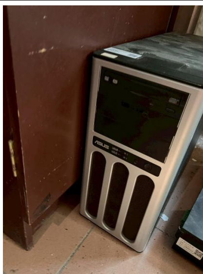
15. 伺服器 1 台