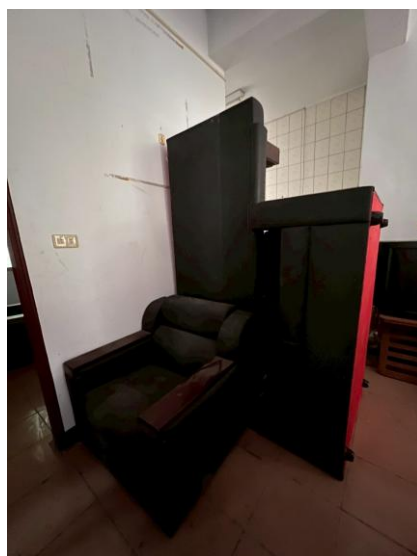
24. 沙發 1 組