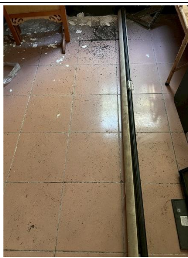
4. 銀幕 1 面