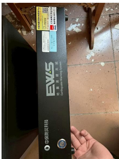
13. 地震預警系統 1 台