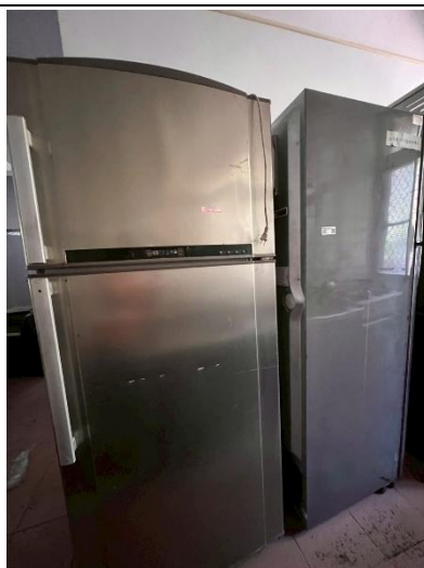
2. 冰箱 2 具