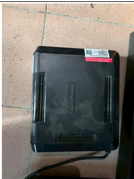
17. 不斷電系統 1 個