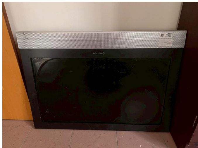
8. 電視機 1 台