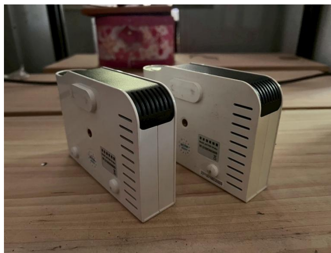
14. 無線投影伺服器 2 組