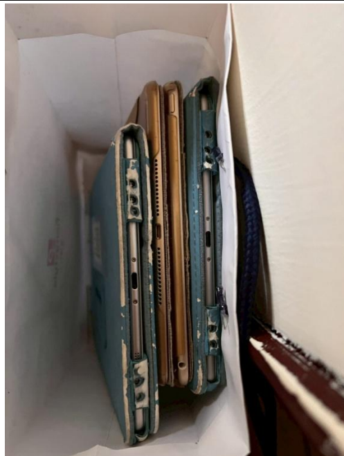
12. 平板 4 台