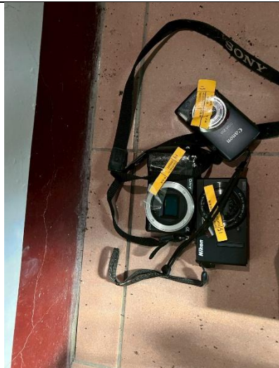
26. 相機 3 架