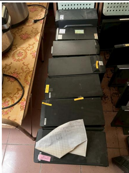
19. 主機 7 台