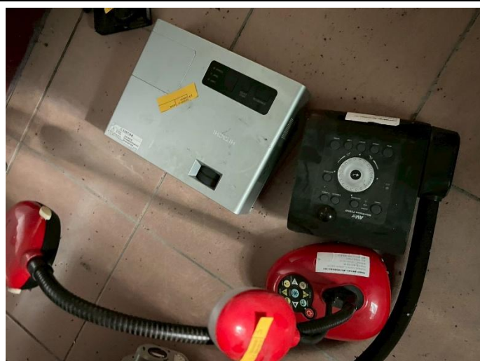
20. 投影機 3 部