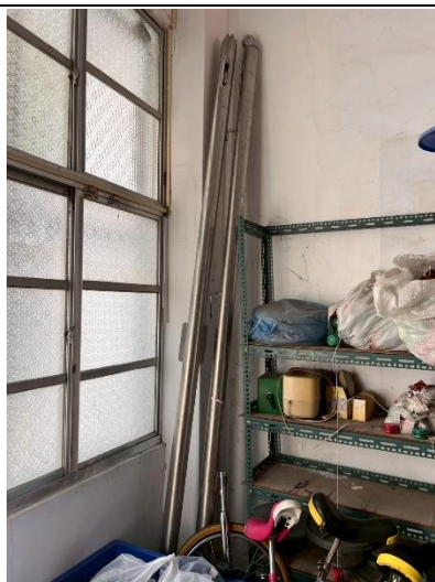
3. 排球扣球柱 1 件