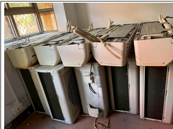
1. 分離式冷氣 5 組