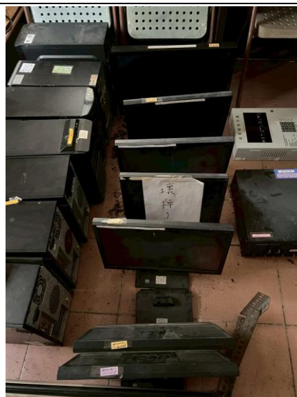
18. 螢幕 7 台