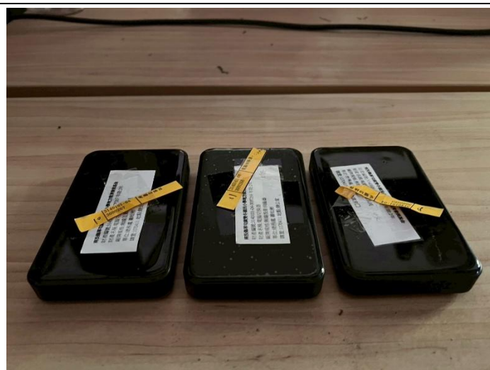
23. 無線互動協作系統 3 組