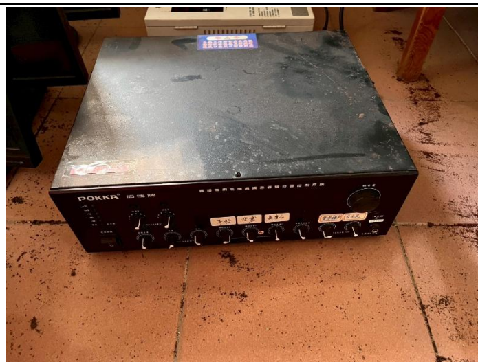
5. 擴大機 1 台