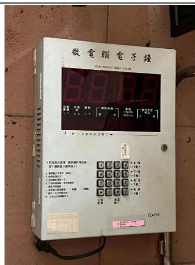
6. 電子鐘 1 個