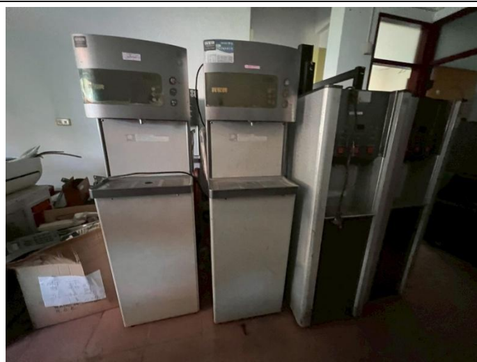
28. 飲水機 4 座