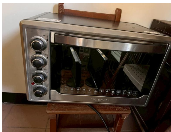
10. 烤箱 1 個