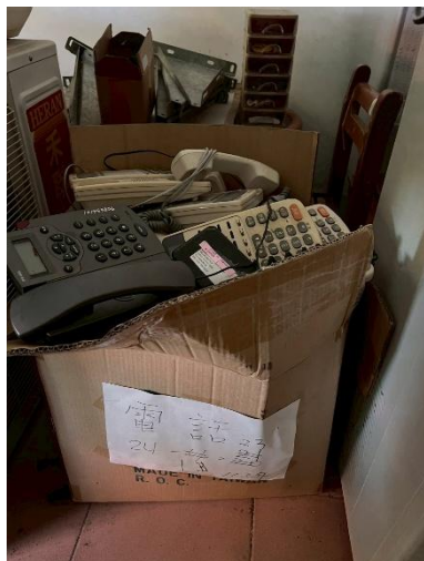
7. 電話 1 套