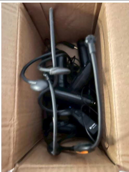
11. 藍芽無線耳麥 5 個