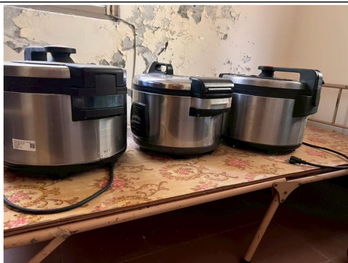
9. 電鍋 3 個