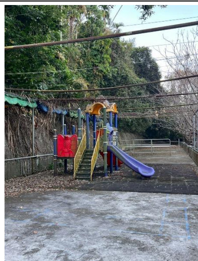
27. 遊戲器材 1 座