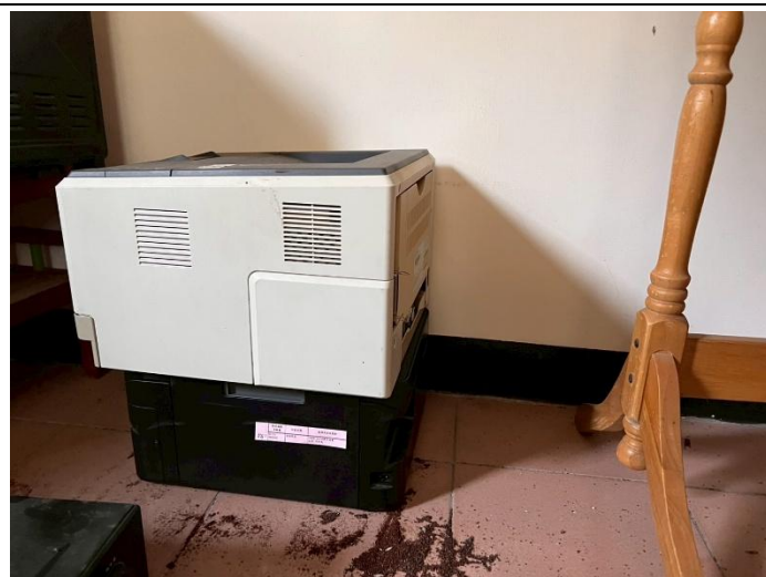
21. 印表機 2 個