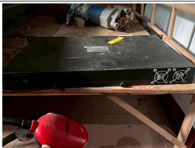
22. 網路防火牆主機 1 式